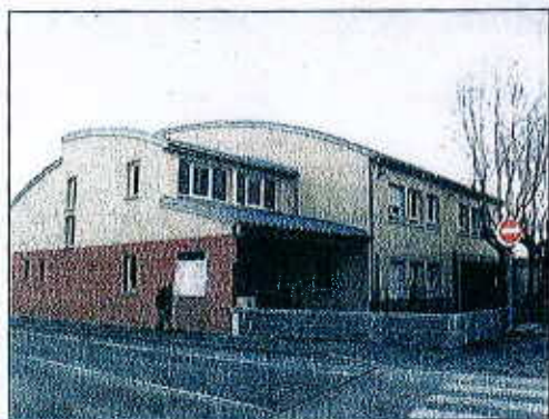
Un bâtiment entièrement neuf, rue Centrale

re pour toutes les classes jusqu'à 18 h 30 animé par Alfa 3A et les inscriptions pour l'année prochaine