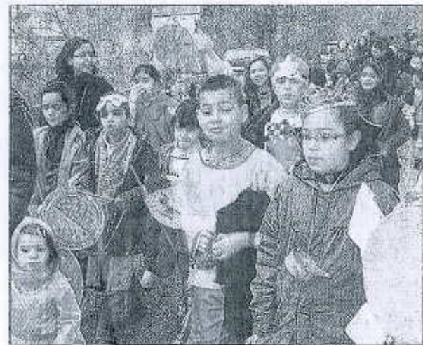
Plus qu'une fête de quartier, le carnaval (ici lors de l'édition 2010) de la vallée de Gère est fédérateur de lien social.