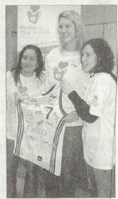
Des joueuses de basket de l'Étoile Voiron.