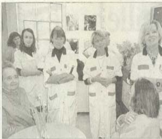
Les personnes âgées se sentent bien dans ce jardin dit "vert".