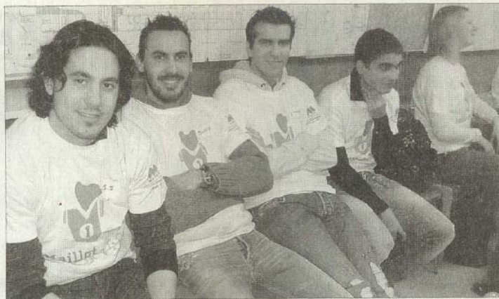
L'association "Un maillot pour la vie" a invité de nombreux sportifs de haut niveau. Parmi les sportifs régionaux ayant répondu présents, le GF 38.