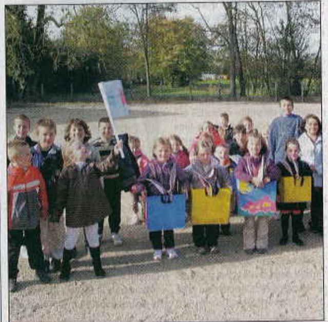
Les centres périscolaires et le centre de loisirs accueillent les enfants de 3 à 16 ans

L'assemblée annuelle des usagers Alfa3A pour les accueils périscolaires de Lent, Servas, Dompierre et Saint-André, s'est tenue, récemment, en présence d'élus des quatre communes, des parents et de leurs représentants.