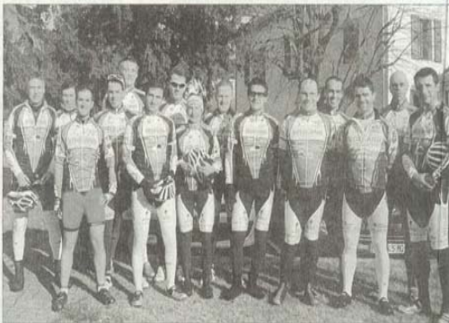
L'équipe TVS (La Tronche Vélo Sport) est d'ores et déjà invitée par les organisateurs de l'épreuve du Tour des Grands Ducs pour venir défendre son titre en mai prochain. Le club espère porter encore plus haut et encore plus fort les couleurs de la Ville en 2011.

L'équipe cycliste tronchoise organise plusieurs épreuves parmi lesquelles deux se déroulent sur le territoire de la Tronche : la montée cycliste des 3 communes (associée à la course pédestre du même nom) le 10 avril et la fameuse Prise de la Bastille le 4 septembre. À ces deux organisations s'ajoute le Tour du Lac de Paladru, une course contre la montre qui attire chaque année près de 300 cyclistes début octobre.