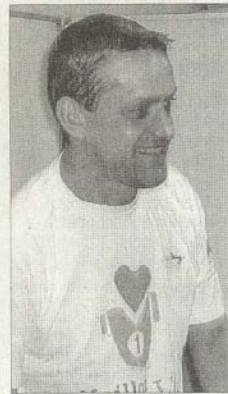
Le champion cycliste Jacky Durand.