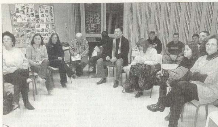
Beaucoup d'échanges lors de l'assemblée plénière des usagers de l'espace jeunes et du centre de loisirs.

tionne très bien, les effectifs ont beaucoup augmenté. 50 % des animateurs sont permanents et titulaires du Bafa. Ils travaillent avec les 3-6 ans. Chez les 6-11 ans, il n'y a qu'une animatrice fixe, les autres sont vacataires.