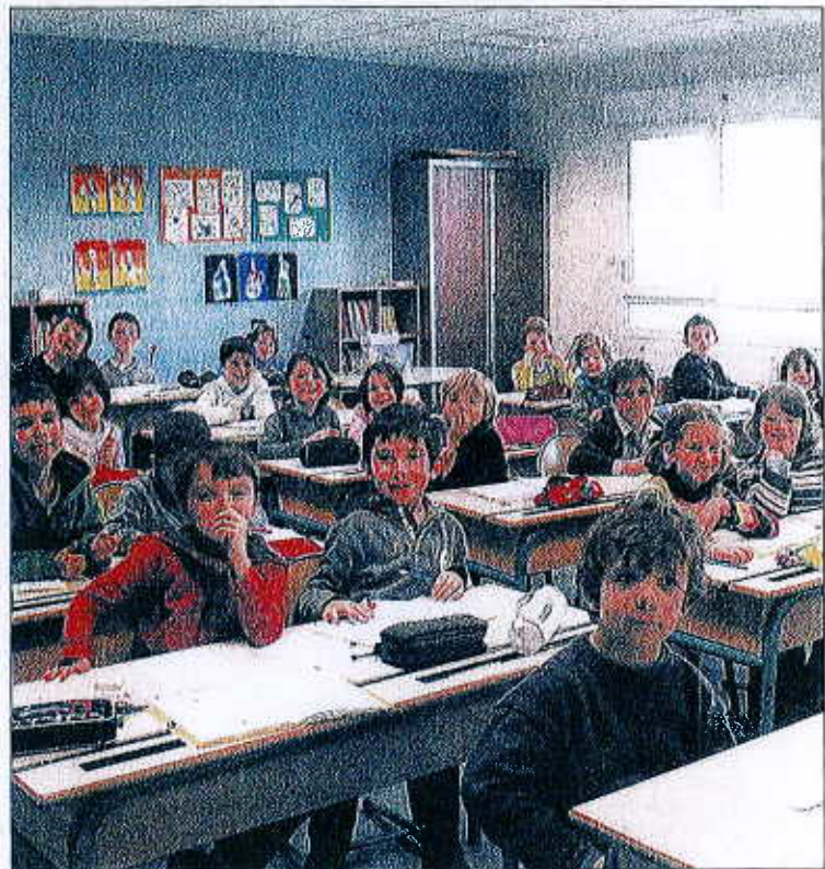
Lundi, les écoliers se sont installés dans leur nouvel environnement