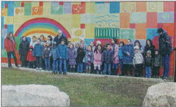
Les enfants du quartier de Geilles ont posé devant leur fresque