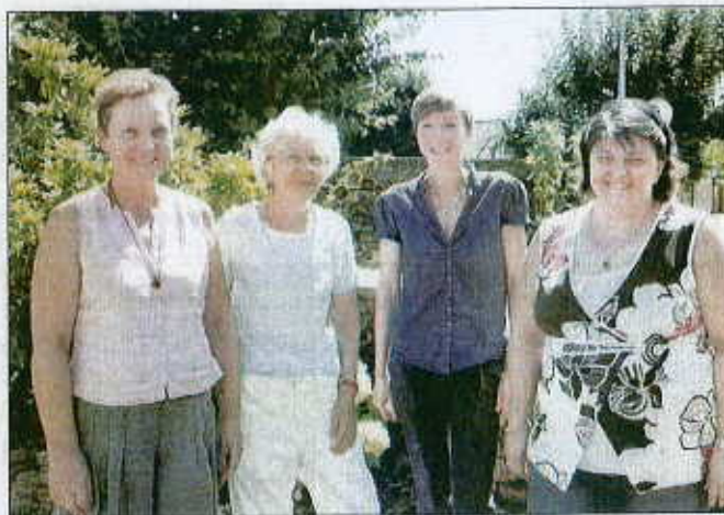
■ La nouvelle équipe de la halte-garderie.