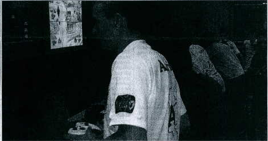
« On organise la nuit des jeux vidéo ». Les anciens à la wii et des tournois pour les plus jeunes

Bien. Mais comment tenir jusqu'au bout de la nuit, voire jusqu'au lendemain ? « Avec la nuit de jeu vidéo. Différents jeux, différentes consoles... Les anciens à la wii et des matches de boxe, des courses de voitures, du bowling... L'association Ain pour tous nous amène du matériel. Ça fonctionne sous forme de