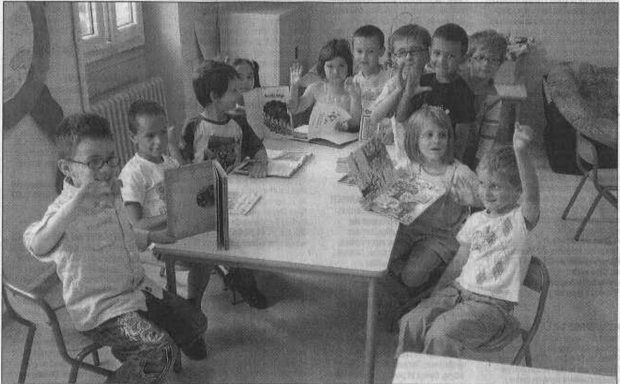
Les petits lisent et dessinent

Le centre de loisirs vient de fermer ses portes après un mois où il a affiché pratiquement complet chaque jour. Il a même fallu refuser quelques enfants qui étaient en surnombre.