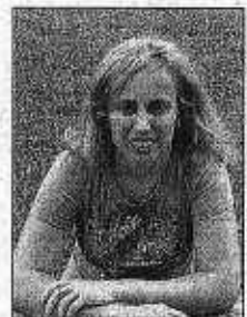
« Ici, c'est tranquille » explique la jeune femme