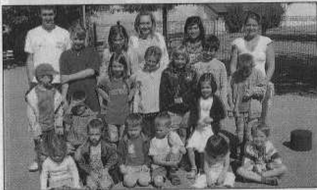
Les enfants et les animateurs