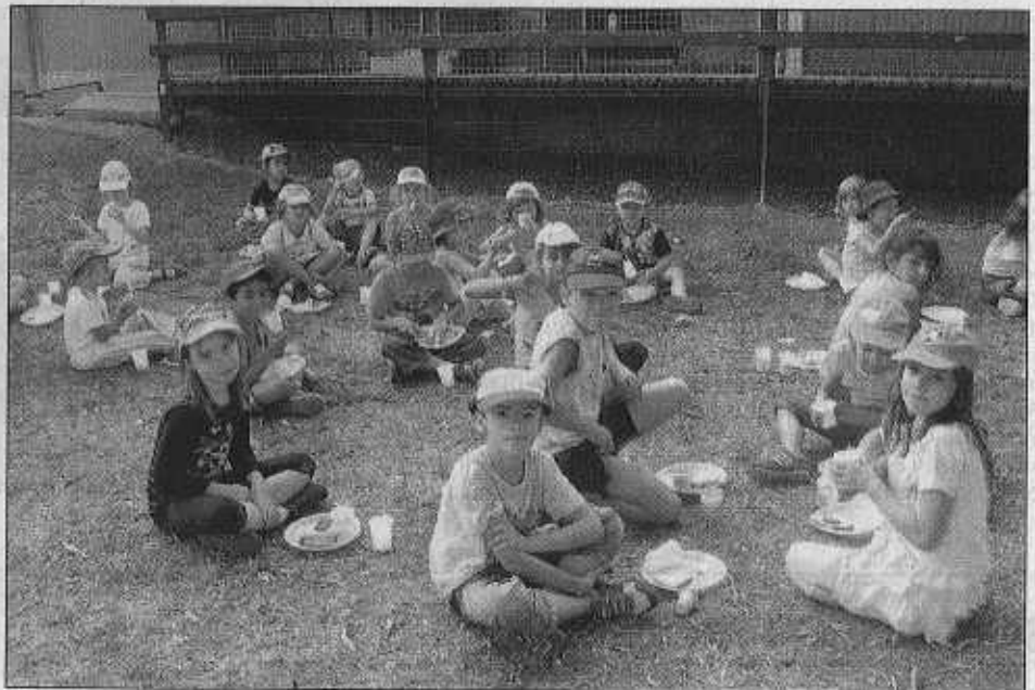
Le banquet des chevaliers / Photo Raymond Mir

A u cours des grandes vacances, le centre d'animation a été transformé en centre aéré pour une cinquantaine d'enfants répartis en trois groupes. Cette dernière semaine, sur le thème commun des chevaliers, les 4-6 ans ont confectionné des boucliers et miroirs, participé à un grand jeu, les 6-9 ans ont fait une course d'orientation et de l'accrobranche, les 9-13 ans ont construit un château, et sont allés eux aussi à l'accrobranche. Tous les enfants ont passé une journée au parc médiéval de Salva Terra, ainsi qu'à la piscine toute proche, et ce vendredi, ils ont participé au grand jeu des chevaliers puis au banquet avant de recevoir les parents et de leur montrer, par une exposition, ce qu'ils avaient pu faire pendant ces journées au grand air, avec les moniteurs du centre.